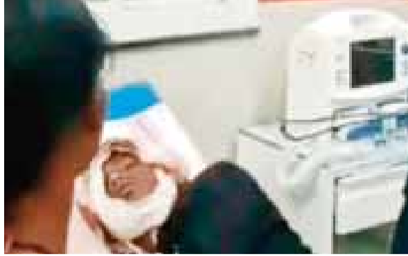
पंहुर्णा